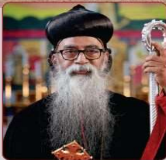
അഭി. ഡോ. യുഹാനോൻ മാർ ക്രിസോസ്റ്റമോസ്