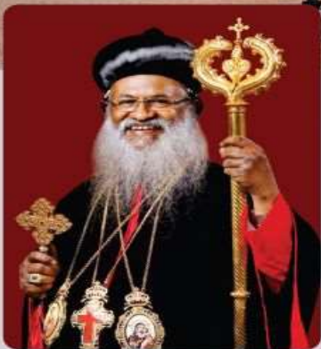
പരി. മോറാൻ മാർ ബസേലിയോസ് മാർത്തോമ്മാ മാത്യൂസ് തൃതിയൻ കാതോലിക്കാ ബാവ