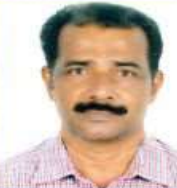
ചെറിയാൻ ഞാമുവേൽ പനായി കടവിൽ സെന്റ് തോമസ്, കല്ലപ്പ